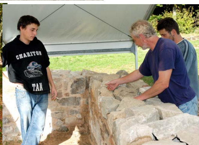
Murs de PC1

Les objectifs de travaux du site de Bibracte sont clairs aujourd'hui pour tous les membres de l'équipe. Ceci nous a conduits à monter un nouveau projet : la création d'un jardin médiéval oriental sur le site de Brancion en Saône-et-Loire. Le travail que nous entreprenons pour ce site permettra aux nouveaux et aux anciens d'appréhender et de développer certaines compétences transversales.