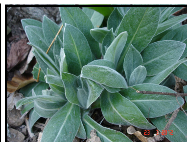
Epiaire de Bizance